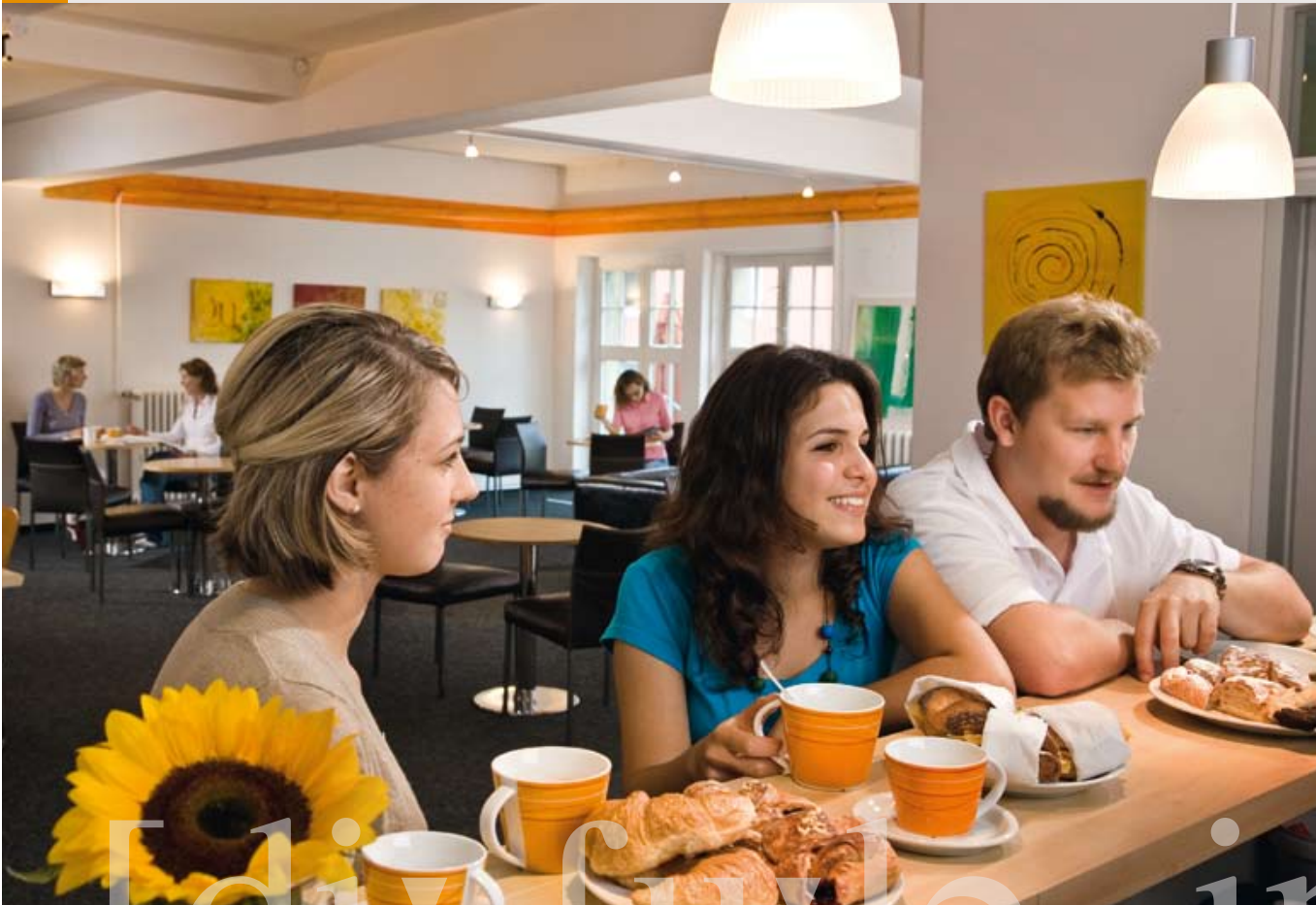
Guter Kaffee, feiner Tee und interessante Gespräche während der Pause.