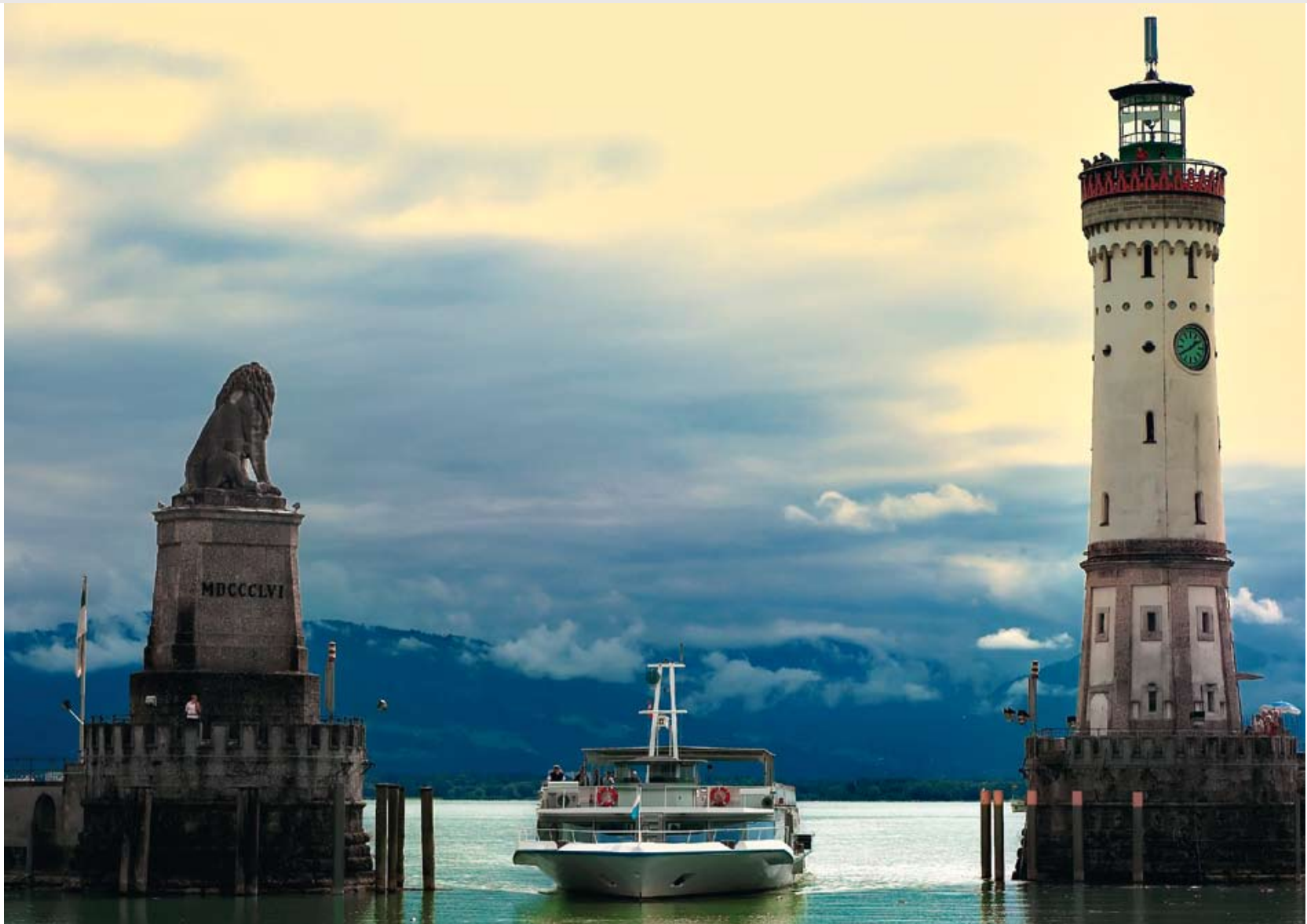
Der atemberaubende Blick von unserer Terrasse!